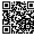
Take It Down